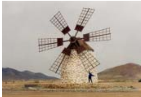
Mauern oder Windmühlen gegen den Wind der Veränderungen bauen?

Buchführung ist definiert als die planmäßige und lückenlose Aufzeichnung aller Geschäftsvorfälle einer Organisationseinheit mit dem Ziel, jederzeit einen Überblick über die Vermögenslage und den Stand der Schulden zu ermöglichen. Die doppelte Buchführung ist das System der kaufmännischen Buchführung gemäß § 238 Handelsgesetzbuch (HGB), welches die Ermittlung eines Periodenerfolges zweifach ermöglicht: Bei der doppelten Buchführung werden die Geschäftsvorfälle in zweifacher