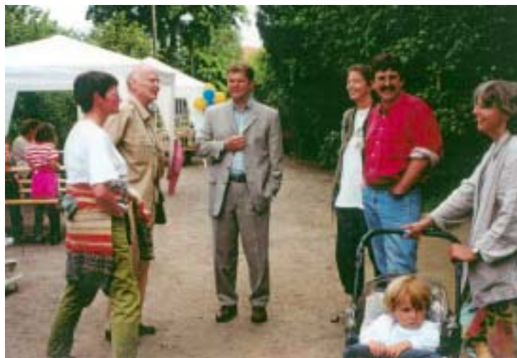
Die Altonaer SPD pflegt seit vielen Jahren Kontakte zu den Ottensener Kleingärtnern. Im Bild links MdB Olaf Scholz beim „Tag des Gartens“ 1999. Foto: „Apfelbaum braucht Wurzelraum“

na bereit, mehrere Kleingartenflächen planerisch für einen Verkauf und eine Bebauung freizugeben. Nach heutigem Stand könnten mindestens 125 Mio. Euro aus den Grundstücksverkäufen realisiert werden. Zu Recht hat der Bezirk diese Grundstücksverkäufe dabei